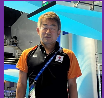
ナショナルヘッドコーチ 野村孝路コーチ