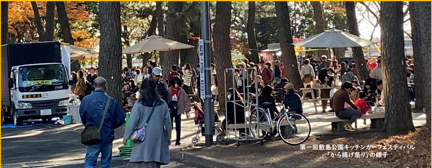
第一回敷島公園キッチンカーフェスティバル 「から揚げ祭り」の様子