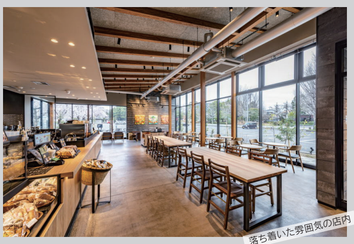
落ち着いた雰囲気のお店