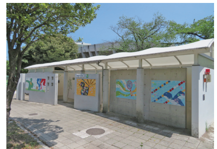
トイレ内には写真やウォールステッカー等で「目」でも楽しめます!