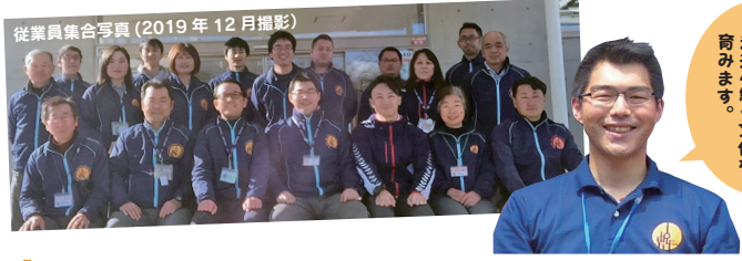
従業員集合写真(2019年12月撮影)