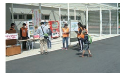
▲敷島公園まつりボランティアのみなさん