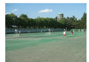
▲「テニスコートの様子」※3

以上が、テニスコートを予約する手順になります。わからないことがあれば管理事務所(023-234-9338 受付時間8時半～17時)までお気軽にお問い合わせください。 是非、敷島公園のテニスコートで汗を流していきましょう!