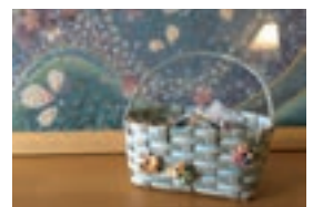
▲「手芸教室作品 -クラフトのミニカゴ-」※3