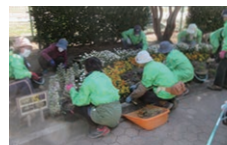
▲花みどりサポーターズ敷島のみなさん

○個人ボランティアのみなさん 花壇の除草・清掃、花がら摘みを行って頂きました。 (4/2、4/16、4/20、4/29、5/7)