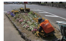
▲ガーデニングボランティア