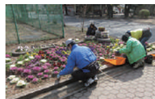
▲県花みどりサポーターズ敷島の皆さん

新シーズン開始の活動として、正田醤油スタジアム群馬のスタンド座席清掃を実施して頂き、約30人の方々に参加して頂きました。