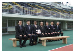
▲県産材ベンチ寄贈式 ※1