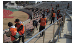
▲ザスパミーティングの皆さん