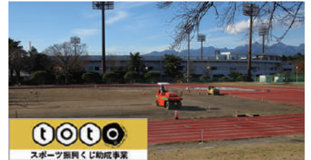
▲補助陸上競技場芝生張り替え工事の様子