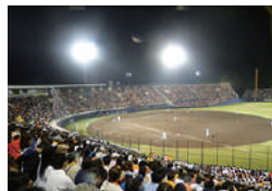
▲プロ野球試合開催 ※2