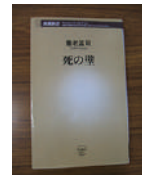
▲本の森おすすすめ本 【死の壁】 養老孟司/新潮新書