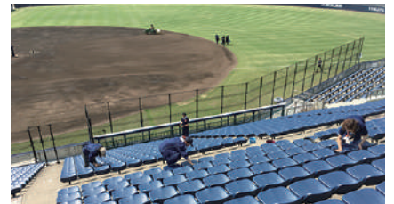
▲野球場観客席清掃の様子

(※芝生張り替え工事はtotoのスポーツ振興くじ助成金を受けて実施されました。)