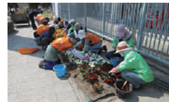
▲花みどりサポーターズ敷島のみなさん

敷島公園でのボランティア活動を随時募集しています。活動内容・時間などお気軽にお問い合わせください。