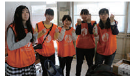
▲敷島公園まつりボランティアのみなさん