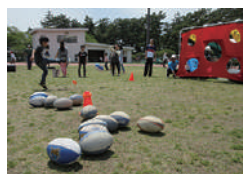
▲敷島公園まつりを開催 ※1