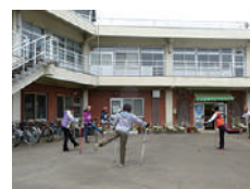
▲ノルディック教室 ※3