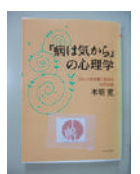
▲本の森おすすめ本 【「病は気からの心理学」 本明寛/PHP文庫