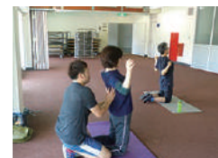
▲心と身体スッキリ塾の様子 ※3