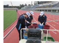
▲勢多農林高等学校 職場体験生

敷島公園でのボランティア活動を随時募集しています。活動内容・時間などお気軽にお問い合わせください。