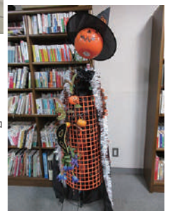
▶公園アーティスト ボランティアの作品