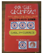
▲本の森おすすめ本 【小さいことによくよするな！】 リチャード・カールソフ/サマーク出版

※詳細内容・料金・お申し込み等は、「敷島公園管理事務所」(電話 027-234-9338)までお問い合わせください