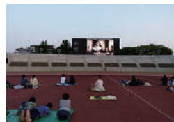
▲ナイトスクリーン開催 ※2（昨年の様子）