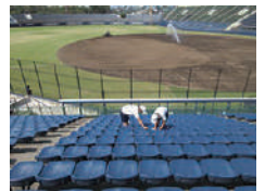
▲市立東中学校 職場体験生

・JA共済連群馬(8/19) サッカーラグビー場の窓清掃、木製ベンチの塗装などを実施していただきました。