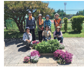
▲花みどりサポーターズ敷島の皆さん