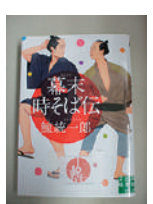
▲本の森おすすめ本【幕末そば広】 鯨統一郎 実業之日本社文庫