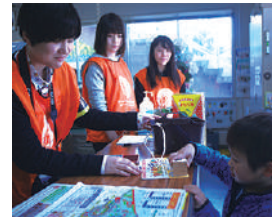
▲敷島公園まつりボランティア (スタンプラリー対応)