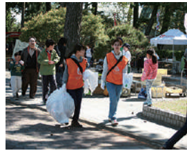
▲敷島公園まつりボランティア (園内清掃)