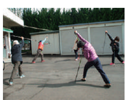
▲ノルディック・ウォーク講習会の様子 ※3