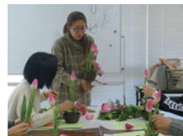
▲フラワーアレンジ教室 ※3