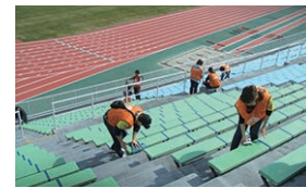
▲ザスパミーティング

・ザスパミーティング(3/5) 正田醤油スタジアム群馬のスタンド清掃作業を行って頂きました。