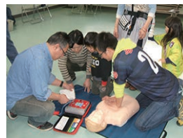
▲救命講習会を実施 ※2