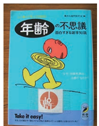
▲本の森おすすめ本 【年齢の不思議】 素朴な疑問研究会/青春出版社

※詳細内容・料金・お申込み等は、「敷島公園管理事務所」までお問い合わせください。