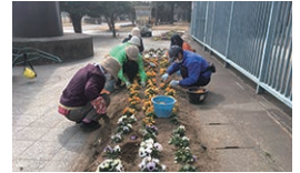
▲花みどりサポーターズのみなさん