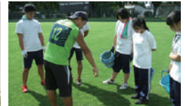
▲勢多農林高等学校職場体験のみなさん