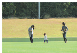
▲県民の日イベントの様子※2