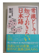
▲本の森おすすめ本 【常識として知っておきたい日本語】 柴田武/幻冬舎