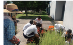
▲花みどりサポーターズ敷島のみなさん