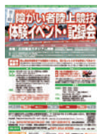
▲障がい者陸上競技体験イベント・記録会※1