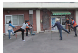
▲ノルディックウォーク教室の様子※3