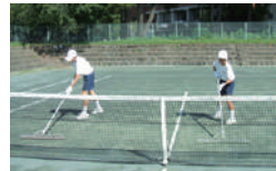
▲東中学校職場体験のみなさん

敷島公園でのボランティア活動は随時募集しています。活動内容・時間などお気軽にお問い合わせください。