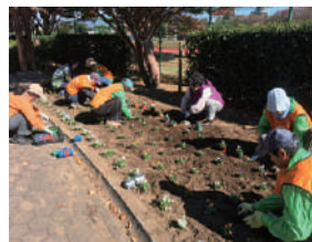
▲花みどりサポーターズ敷島のみなさん