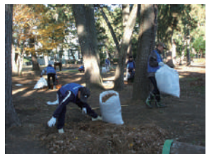
▲J A 共済連群馬のみなさん