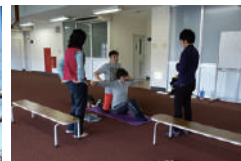
▲心と身体スッキリ塾 ※3 の様子