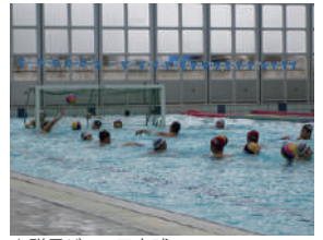
▲群馬ジュニア水球

現在も、敷島公園水泳場では、週に4日、群馬ジュニア水球の子供達が元気に練習を行っています。未来のオリンピック選手も排出されるかもしれません。リオデジャネイロオリンピックの水球競技を応援しましょう!