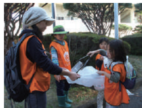
▲クリーンボランティア

近隣の小学生が園内ゴミ拾いボランティアとして活躍中です! 敷島公園でのボランティア活動は随時募集しています。ぜひ、お問い合わせください。