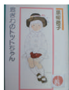
▲本の森おすすめ本 【窓ぎわのトットちゃん】 黒柳徹子 講談社