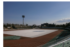
▲養生シート設置状況 ※2