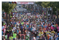
▲県民マラソン ※1 スタート地点の様子