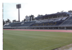
▲スタジアムキャンプ開催 ※3