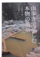
▲本の森おすすめ 【山歩きで楽しむ本物の温泉】 石川理夫 アテネ書房