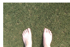
▲天然芝体験イベント開催 ※2