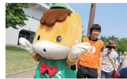
▲敷島公園まつりボランティア

敷島公園では、これまでの活動の他に、新たに「本の森ボランティア」も募集しています。お気軽にお問い合わせください。