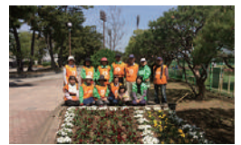
▲花とみどりサポーターズのみなさん