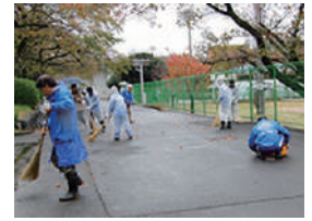
▲J A 共済連群馬