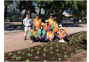
▲花みどりサポーターズ敷島