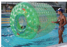
▲ウォーターバレーン※1