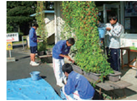
▲職場体験 (芳賀中学校・南橋中学校)