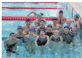
▲貴田選手と記念撮影※2