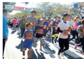
▲群馬県民マラソン※3