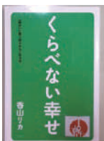
▲「本の森」おすすめ「くらべない幸せ」 香山リカ/大和書房