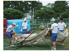
▲職場体験 (第三中学校)

・職場体験学習 市立第三中学校 (10/7～9) / 県立前橋商業高校 (10/14～10/15) 市立南橋中学校 (10/15～17) / 市立芳賀中学校 (10/16・17)