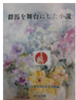
▲【群馬を舞台にした小説 (みやま文庫)】