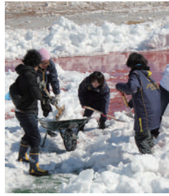
ザスパボランティアのみなさん

個人ボランティア【のべ 257 人(3 月20 日現在)】 雪かきのお手伝いなどをして頂きました。 団体ボランティア【のべ 359 人(3 月20 日現在)】 ・花みどりサポーターズ敷島 3月6日(花柄摘み)、15日(花壇手入れ)をして 頂きました。 ・ザスパクサツ群馬サポーター 2月22日に約60人のボランティアが集まり、雪か き作業をして頂きました。