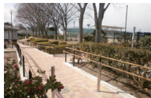
▲新しくなった施設紹介「園路バリアフリー化」※3