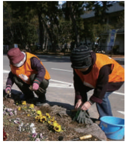
花みどりサポーターズ敷島