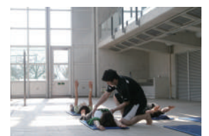
▲敷島スポーツ塾「ボディシェイプ講座」※4