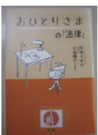
▲「本の森」おすすめおひとりさまの「法律」