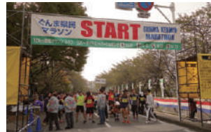
▲「ぐんま県民マラソン」のスタート地点※2