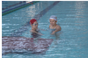
▲オリンピック出場選手によるレッスン※1