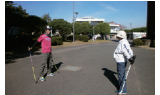
▲ノルディック・ウォーキング講習会の様子※3