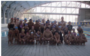
▲群馬県民の日、無料開放の水泳場での集合写真※1