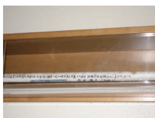
▲展示している「やり」

正田醤油スタジアム群馬入口正面ホールの壁には過去の競技会で出た記録を留める「競技記録表」が貼ってあります。現在表示されているのは丁度 30 年前に開催されたあかぎ国体時、やり投げで出された日本新記録 87.18m に関するもので、使用された「やり」の現物も飾って