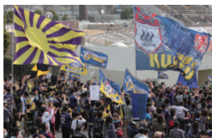
▲Jリーグディビジョン2開幕※1