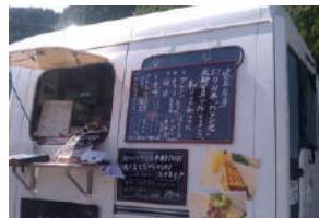
▲「和ゴン」出店！是非足を運んでみてください。※2