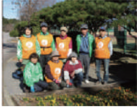
※花みどりサポーターズ 敷島のみなさん