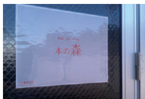
▲新企画!「本の森」 皆様からの本の寄付をお待ちしています。※1