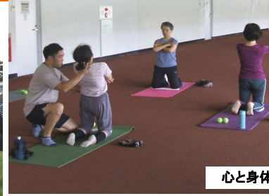
心と身体スッキリ塾