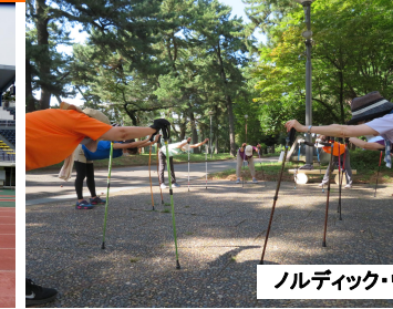
ノルディック・ウォーク教室